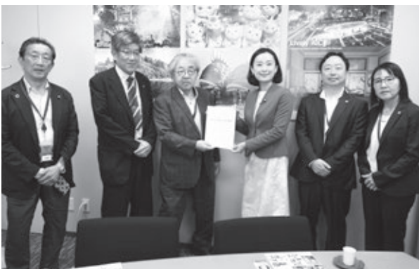
田島麻衣子参議院議員