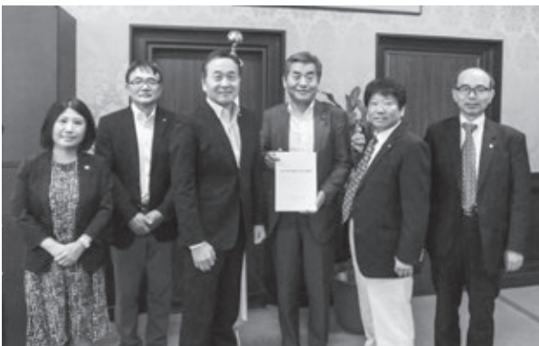
神田憲次衆議院議員