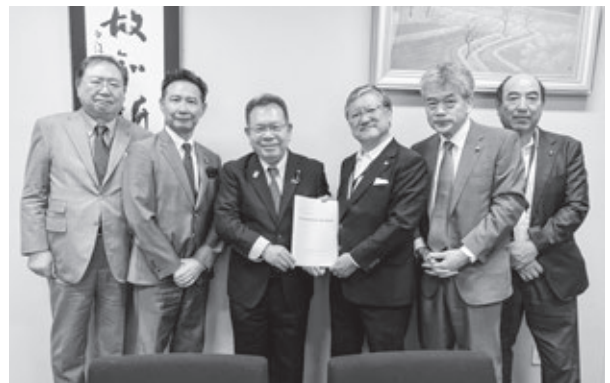
酒井庸行参議院議員