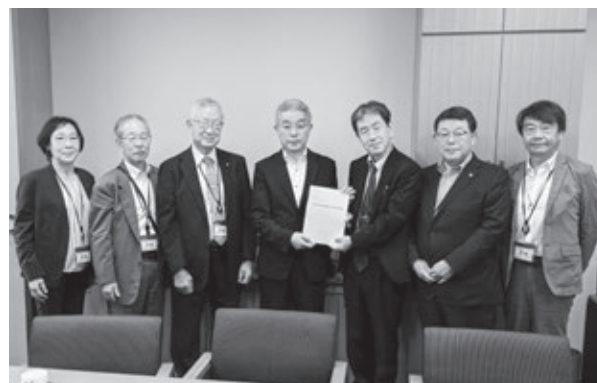
牧 義夫衆議院議員