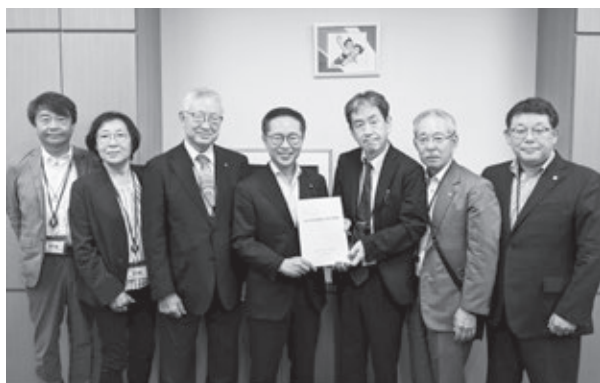
古川元久衆議院議員