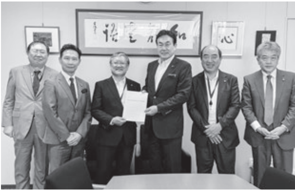
藤川政人参議院議員