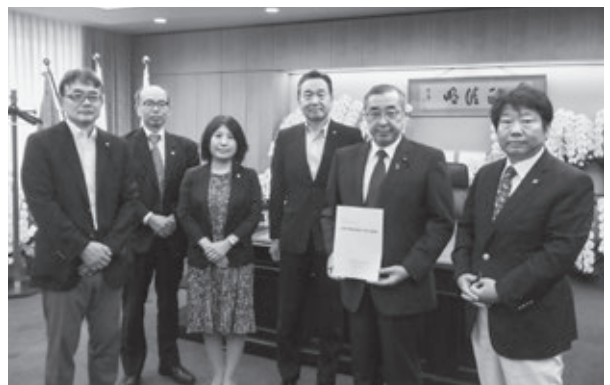
鈴木淳司衆議院議員