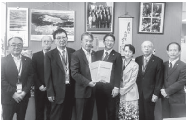
大野泰正参議院議員