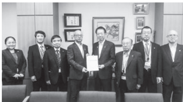
武藤容治衆議院議員