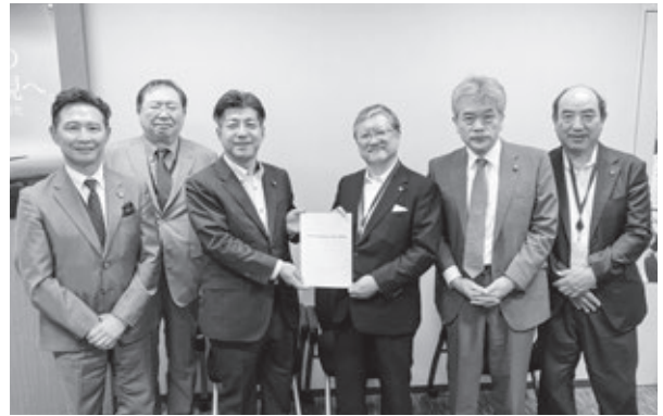
里見隆治参議院議員