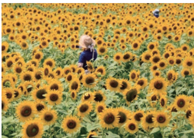
広報委員長賞 ひまわりの小径 荒井伸也 (名古屋中)