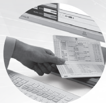
預金通帳・証ひょう