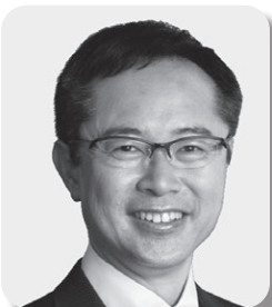
国民民主党 衆議院議員 古川 元久

今年も、税理士の先生方の献身的なお取り組みや職務への大きな誇りを、改めて実感させていただき、引き続き、税制改正や税務行政に全力で取り組んでいくことを決意いたしました。