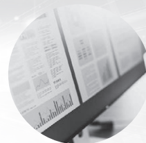
銀行・クレジットカードCSV