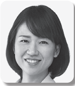
国民民主党 参議院議員 伊藤 孝恵

国家の基盤である税制を支え、地域の生業や暮らしに伴走する皆さまのご努力の毎日に心からの敬意を捧げます。