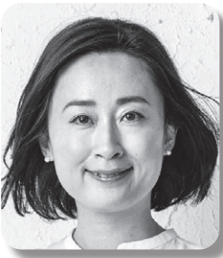
立憲民主党 参議院議員 田島麻衣子

これからも、税理士の皆さまに知恵を授けて頂きながら精進して参ります。ご指導いただきますことを伏してお願い申し上げます。